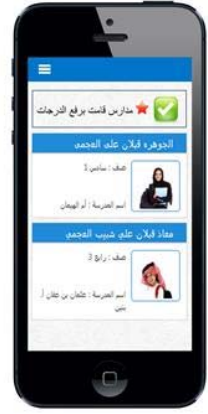
تطبيق المبادرة الوطنية للتعليم الإلكتروني (طالب) على الموبايل

المبادرة الوطنية للتعليم الإلكتروني (طالب)