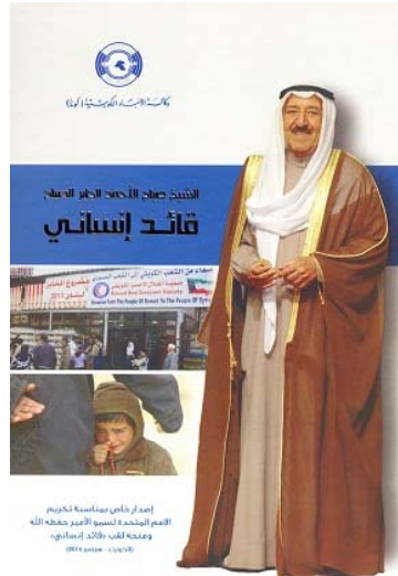
إصدار خاص بمناسبة تكريم حضرة صاحب السمو أمير البلاد المفدى الشيخ صباح الأحمد الجابر حفظه الله ورعاه قائد للعمل الإنساني